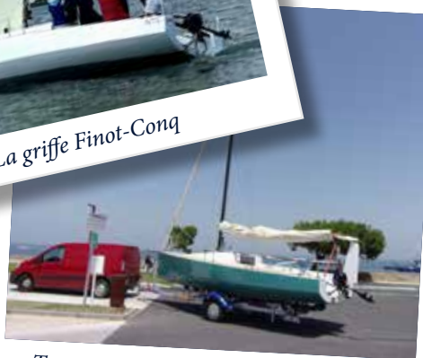
Transport et mise à l'eau ultra simple