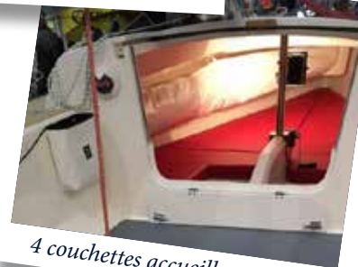
4 couchettes accueillantes