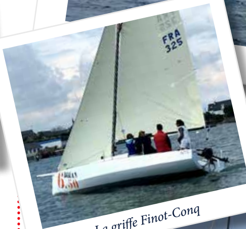
La griffe Finot-Conq