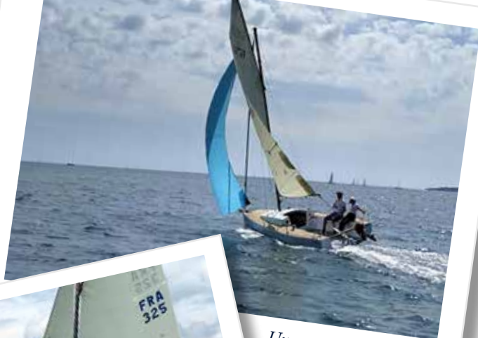
Une parfaite élégance

Classique & moderne Choix des couleurs Pont aspect teck Gréement houari